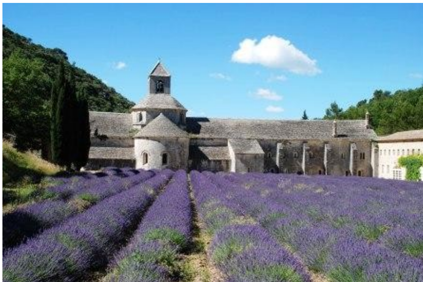
Abbaye de Sénanque

Les Souvenirs d'enfance de Marcel Pagnol avec les 2 volumes de La Gloire de mon père et Le château de mamère, ainsi que les 2 tomes de l'Eau de la Colline : Jean de Florette et Manon des Sources, remarquablement mis à l'écran avec Yves Montand, Daniel Auteuil, Emmanuelle Béart et Gérard Depardieu, dont de très nombreuses scènes ont été tournées dans le Luberon.