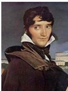
François Marius Granet