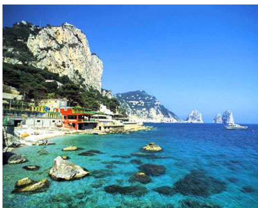
Capri et ses fameux « faraglioni »

Considérée depuis toujours comme le lieu de récréation de la baie de Naples, Capri a attiré les personnalités les plus illustres, de l'empereur Auguste à Maxime Gorki, qui s'est entretenu ici avec Lénine et Staline. De nos jours, l'île nous enchante par ses falaises majestueuses, ses ruines romaines et ses eaux bleues et limpides.