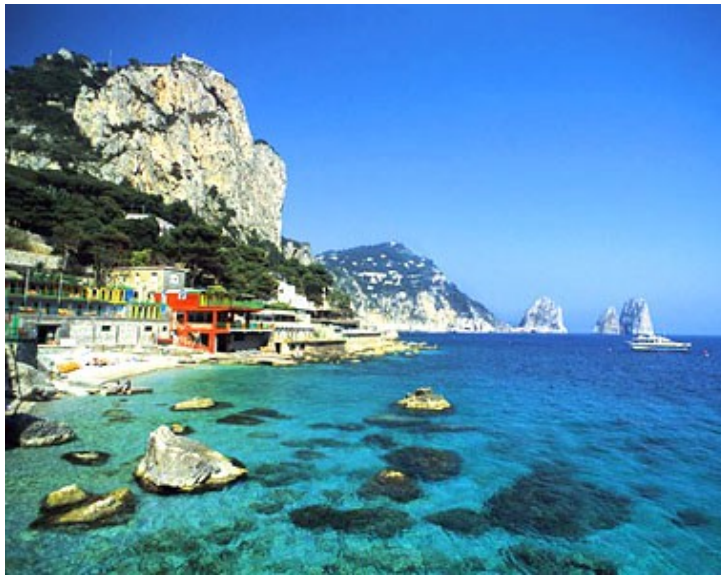
Capri et ses fameux « faraglioni »

Considérée depuis toujours comme le lieu de récréation de la baie de Naples, Capri a attiré les personnalités les plus illustres, de l'empereur Auguste à Maxime Gorki, qui s'est entretenu ici avec Lénine et Staline. De nos jours, l'île nous enchante par ses falaises majestueuses, ses ruines romaines et ses eaux bleues et limpides.